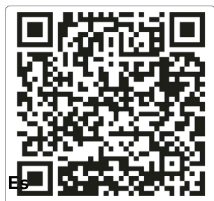
Estares Official YouTube