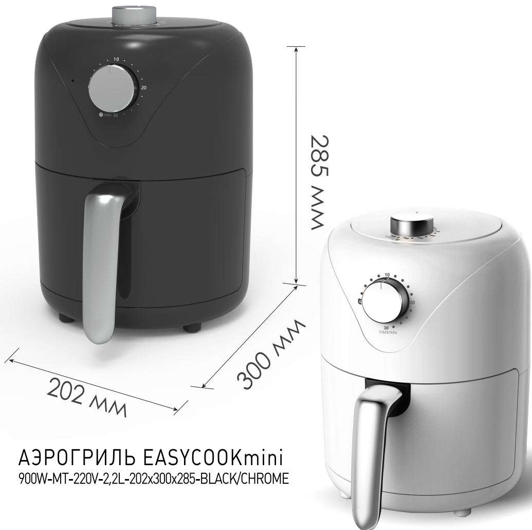
АЭРОГРИЛЬ EASYCOOKmini 900W-MT-220V-2,2L-202x300x285-BLACK/CHROME